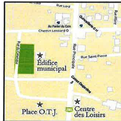
Infographie: Isabelle Léger

Municipalité St-Cyrille munstcyrille@globetrotter.net 282, rue Principale Saint-Cyrille-de-Lessard GOR 2W0